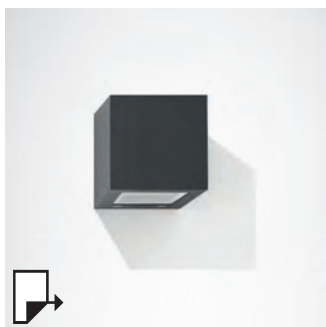
pg 266 QUASAR 10