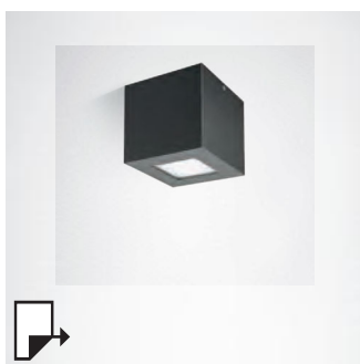
pg 248 QUASAR 10 CEILING