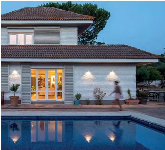
Private house - Andalusia - Spain